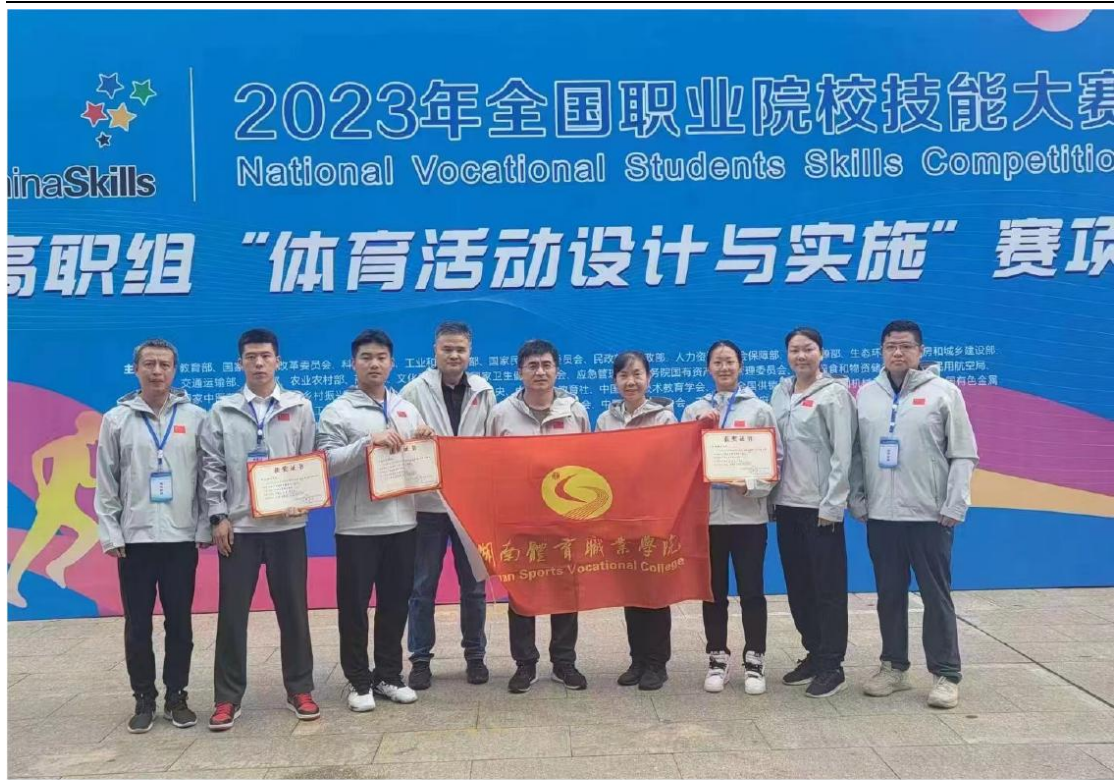
體育活動設計與實施賽項團隊榮獲國賽三等獎