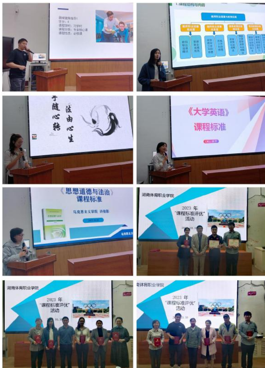
部分参评教师在陈述课程标准及颁奖现场

课程标准评选活动，彭院长在活动总结上高度肯定参评教师的认真态度和素质水平，指出课程标准存在的问题，并提出相关要求。